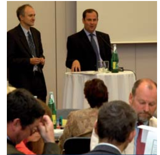
BM Josef Pröll mit Mitarbeitern

Fortschritte und Ergebnisse des Projekts berichtet wurde. Speziell das Projektteam und die ausgewählten internen Berater engagierten sich in der aktiven Kommunikation und der Auseinandersetzung mit ihren Kollegen und deren Anliegen. Gespräche – nicht nur in Teammeetings, sondern auch am Gang und in der Kantine – zum Thema Leitbild fanden statt. Es hat berührt!